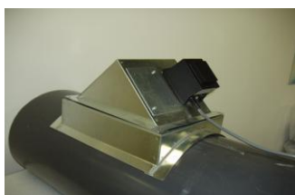
Montagedetalj för rundkanal med kanalpåslag