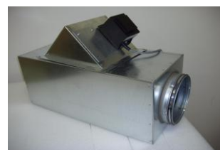
Monteringslåda med kanalpåslag